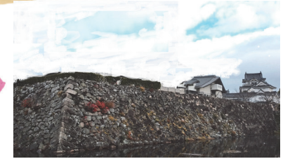
写真合成 井舎英生