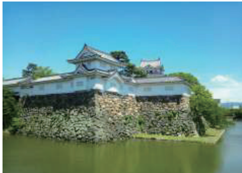
写真2. 岸和田城