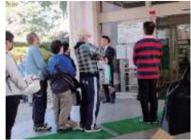
写真4：図書館まつり