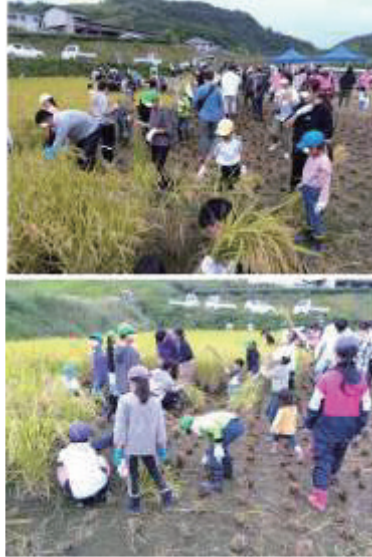
写真3：東葛城小学校ポスター（提供：東葛城小学校）、稲刈り体験／写真：昼馬光一