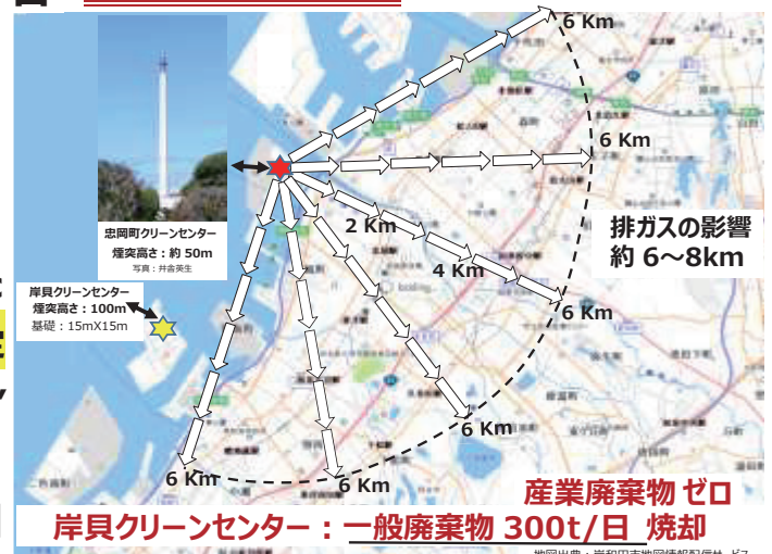
図1: 産廃焼却炉と岸和田市への影響/作図 井舎英生

忠岡町新浜 2033年～ 忠岡町・ 大栄環境(株)・ 三菱重工 etc 公民連携協定 “産廃焼却炉” 設置 Max 220t/日