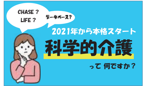
イラスト1：宇野真悟

って住み慣れた地域で自分らしく暮らし続けることのできる地域共生社会の実現につながると考える。